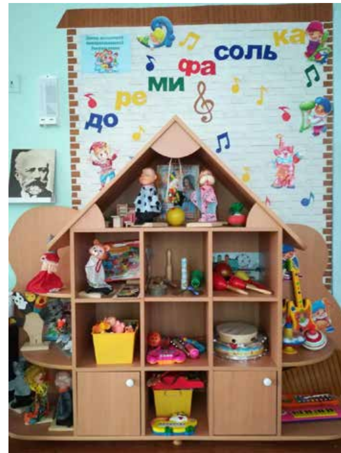
Коррекционная развивающая предметно-пространственная среда