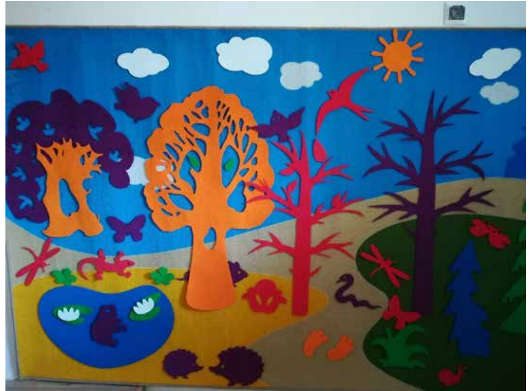
Коррекционная развивающая предметно-пространственная среда