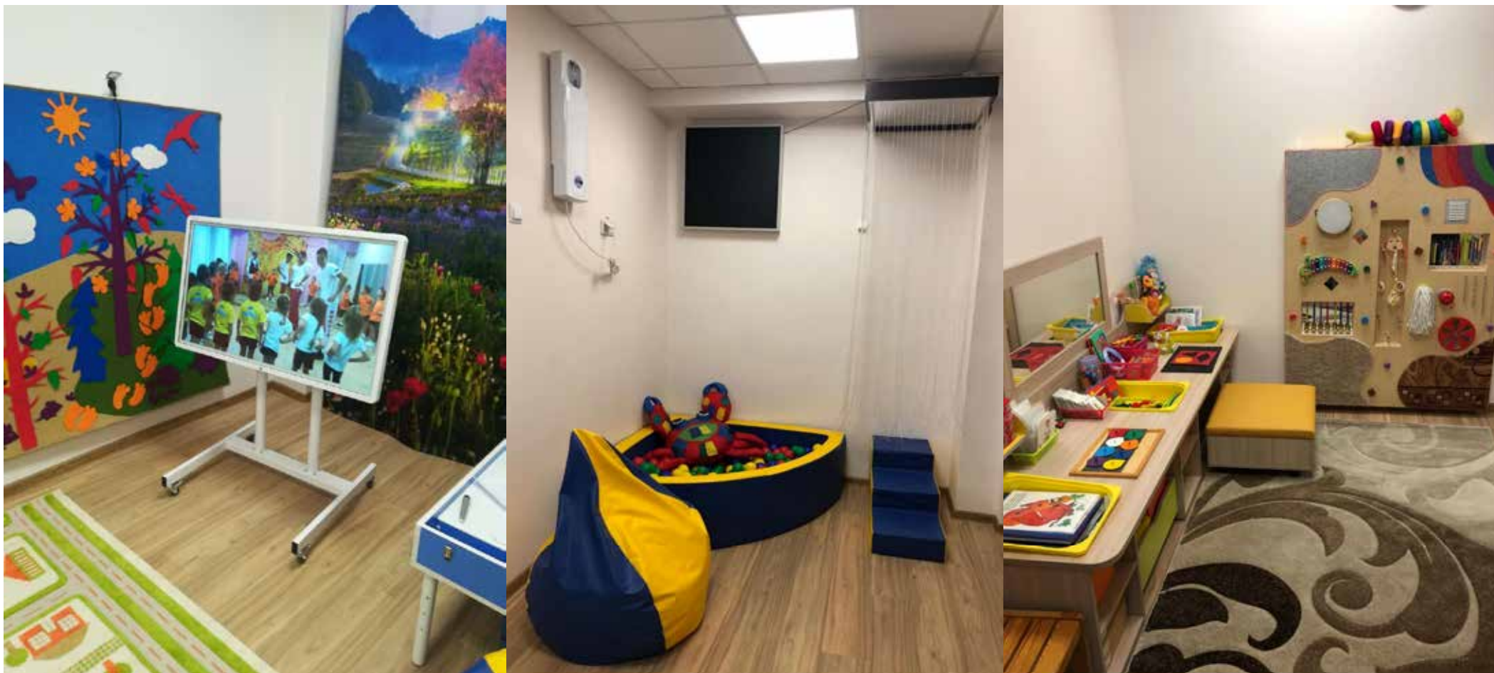
Кабинеты учителя-логопеда, учителя-дефектолога, педагога-психолога