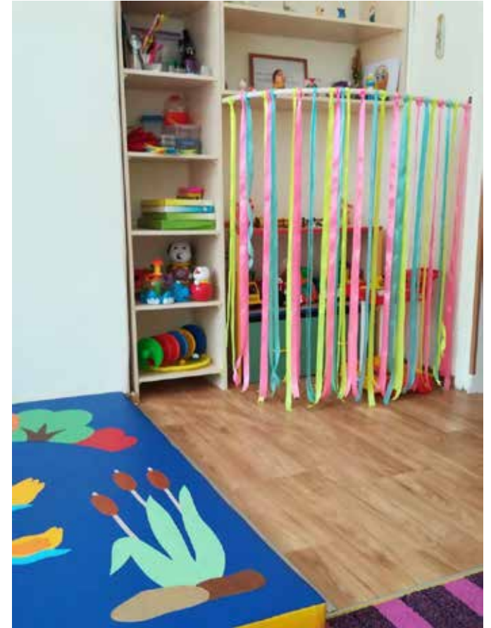
Коррекционная развивающая предметно-пространственная среда