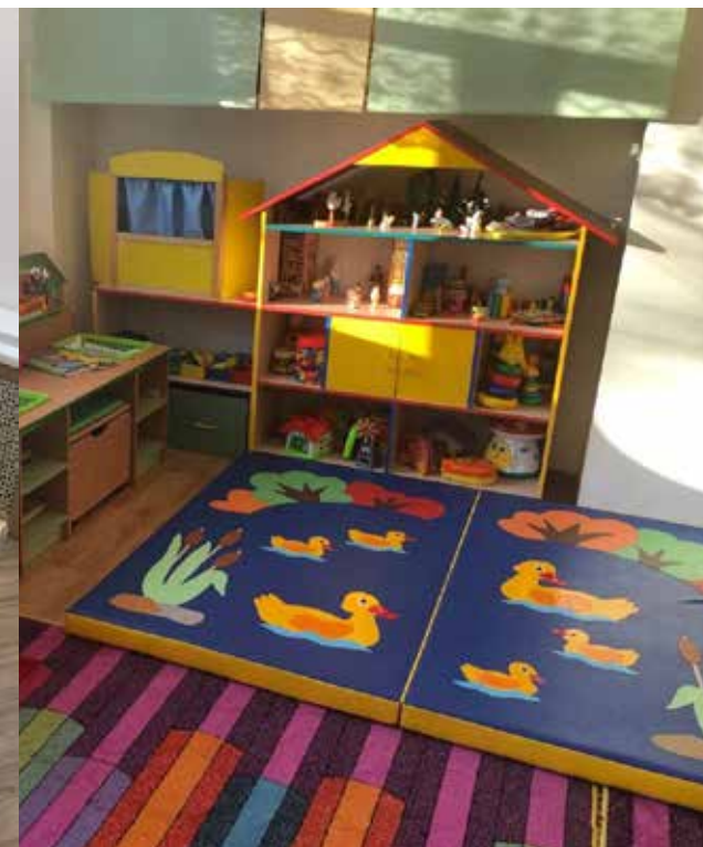
Оборудование игровых и учебных помещений групп