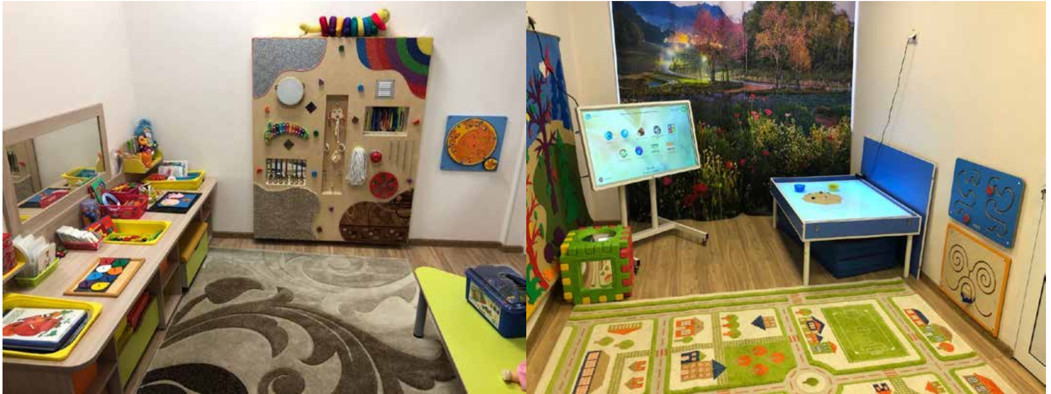
Кабинеты учителя-логопеда, учителя-дефектолога, педагога-психолога