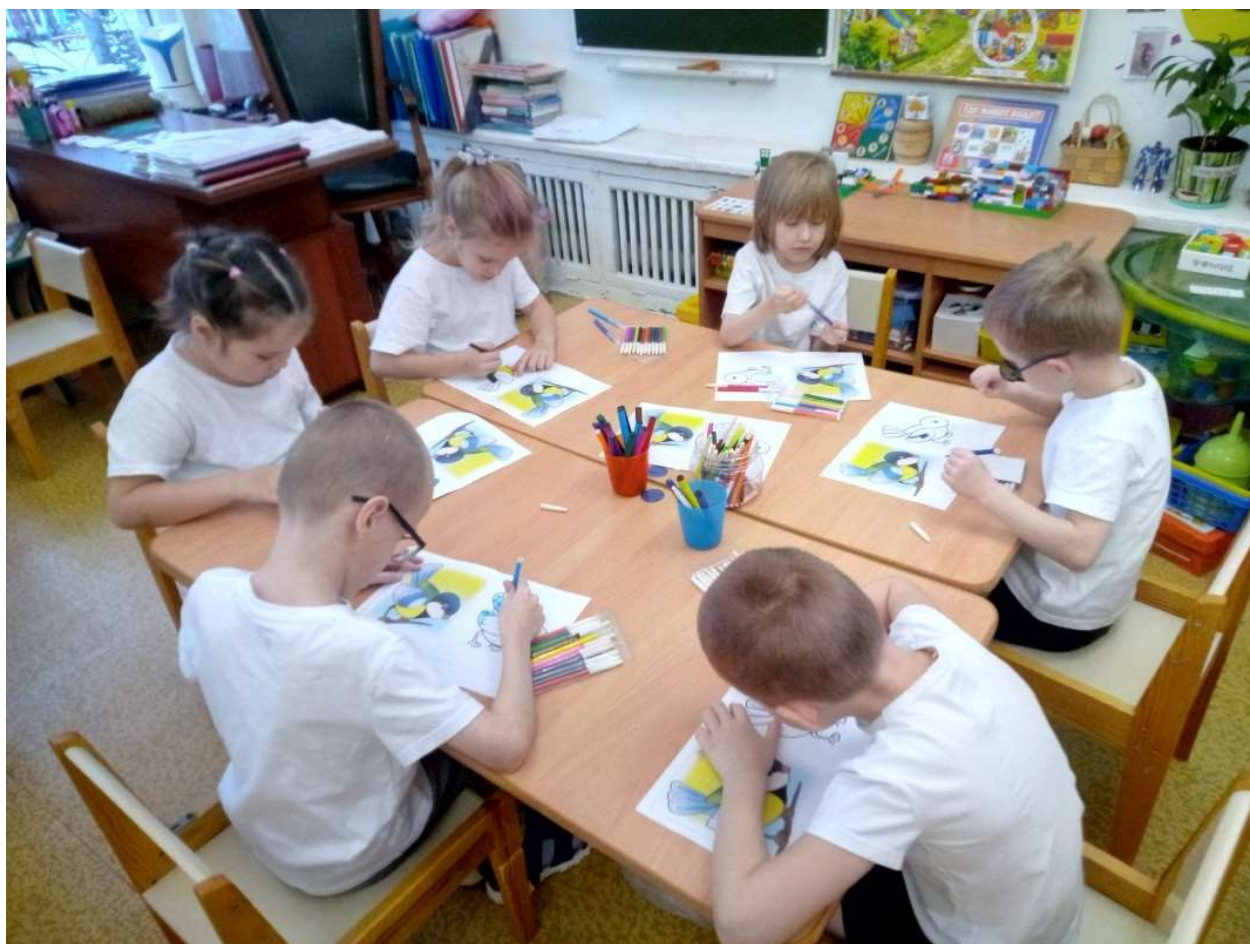
Фото - отчёт