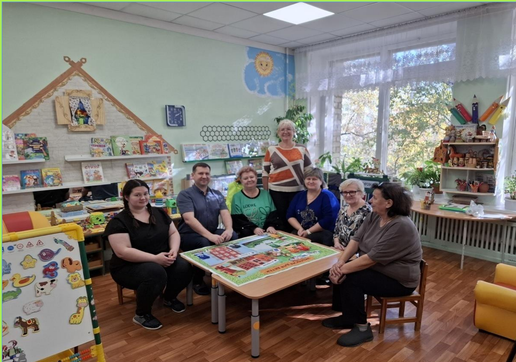
Круглый стол рабочей группы педагогов, посвященное реализации программы "Экологическое волонтерское движение как средство социальной и психологической адаптации детей дошкольного возраста с особыми образовательными потребностями»