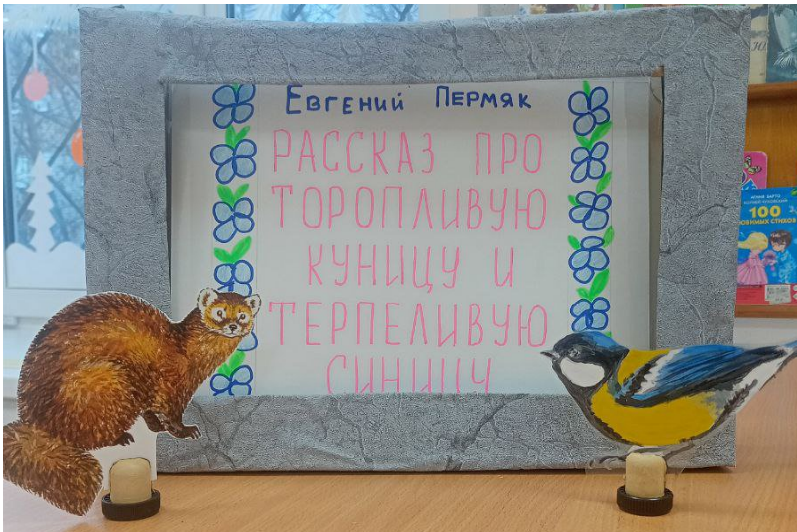
Театр из бросового материала